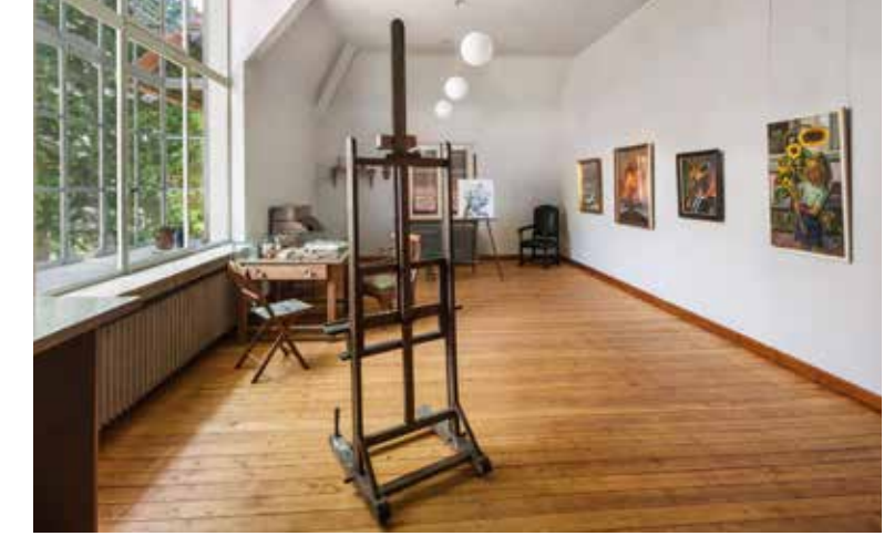
Das Atelier von Otto Dix mit dem nach Osten ausgerichteten Fensterkasten

TAG DER OFFENEN TÜR / OPEN HOUSE-STUDIO VISIT 28. Mai 2017, Öffnungszeiten 10 bis 21 Uhr ... Die Künstler weisen sich zur besseren Auffindbarkeit vor Ort mit einem Kulturpunkt aus.